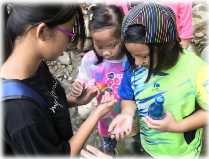
▲ 生態體驗-讓孩子近距離看見自然之美