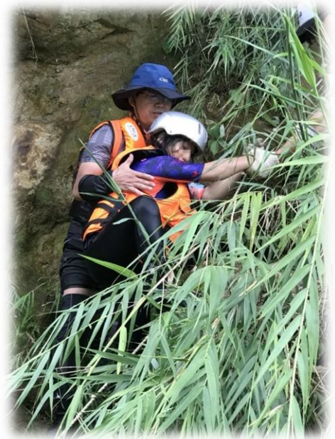
▲ 互助合作一起攀下山壁