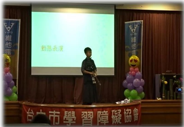
▲ 小樹築夢計畫-劍道表演