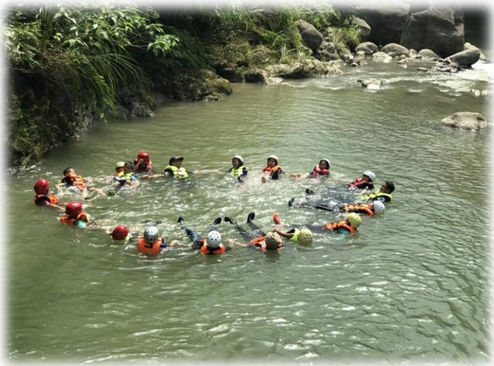
▲ 同心協力一起在水上漂浮

這次的暑期特別活動，我們舉辦了兩天一夜的親子體驗營，讓家長與孩子走入森林，體驗刺激的溯溪、知性的生態導覽、美味的烤肉以及有趣的藍染，不僅增進了親子間的關係，也帶給孩子不一樣的暑假回憶。