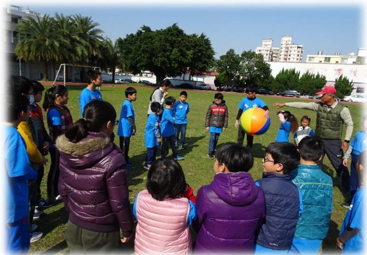
▲ 透過拍球活動增進團體默契