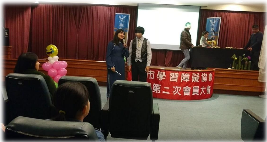
▲ 小樹築夢計畫-相聲表演

透過小樹築夢計畫，鼓勵學障孩子克服自身困難，培養專長及興趣，我們相信只要給孩子舞台，再加上自身努力，學障孩子也可以在大家面前發光發熱。