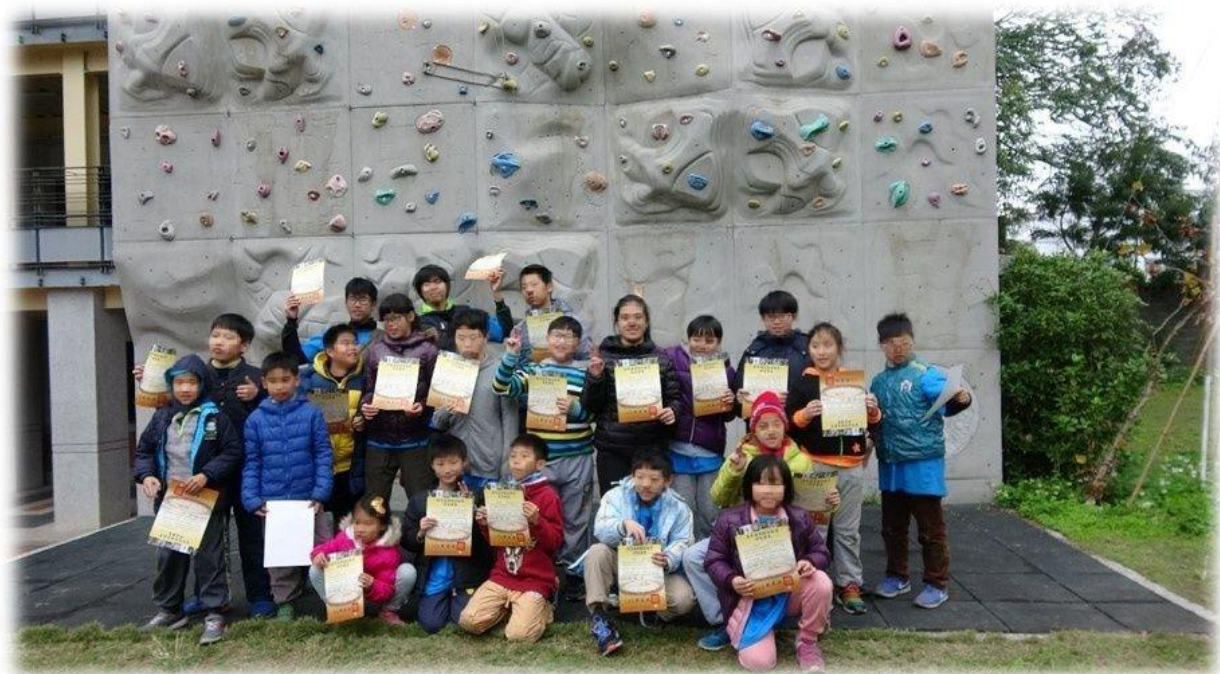
▲ 攀岩後全體合照紀念